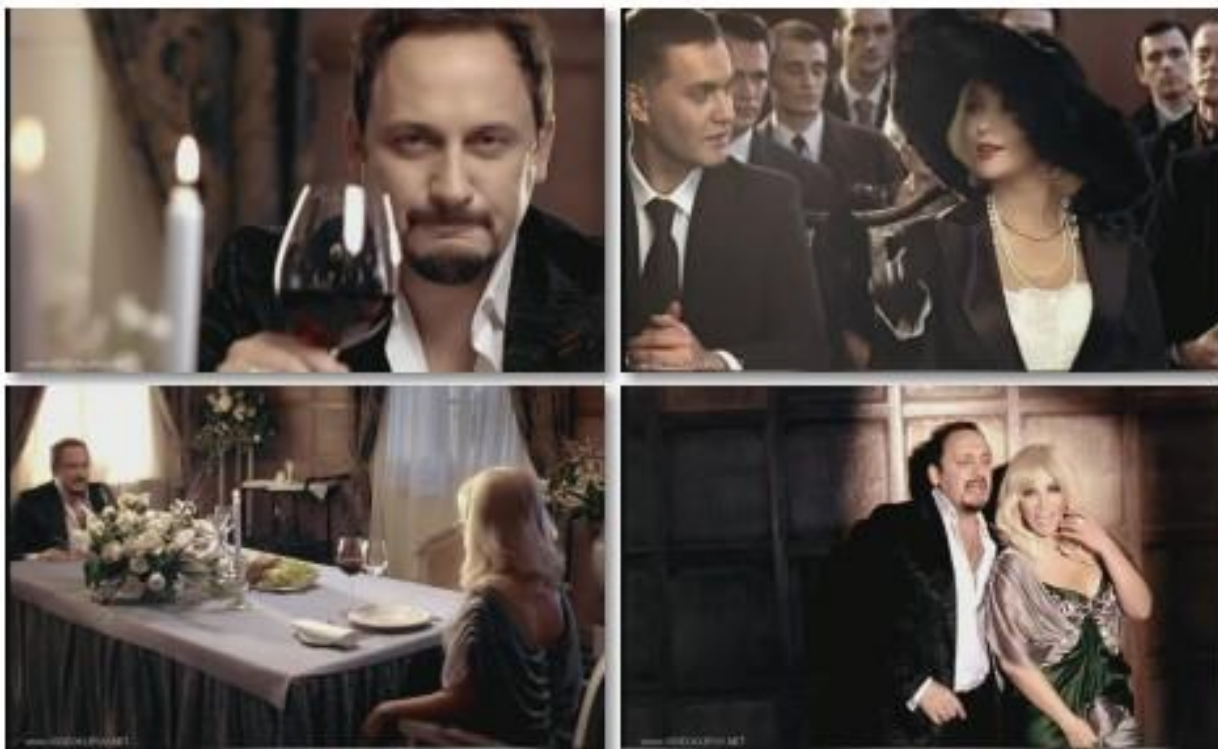
Таисия Повалий и Стас Михайлов – «Отпусти» http://www.youtube.com/watch?v=83dM9LN83pI Музыка и стихи С. Михайлов